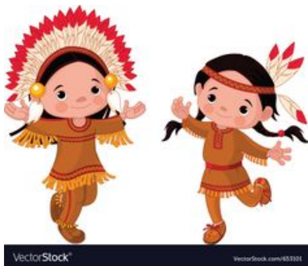
To mali Indianie.