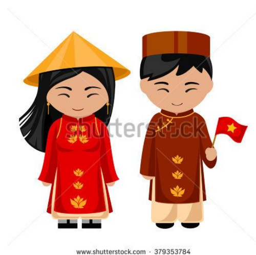
To dzieci z Chin.