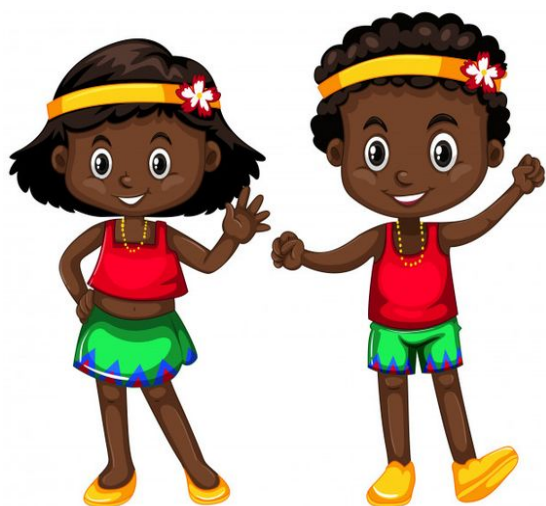
To dzieci z Afryki.

3. Popatrzcie na ilustracje przedstawiające dzieci z różnych stron świata. Z pomocą rodziców odczytajcie skąd pochodzą, lub jak się nazywają.